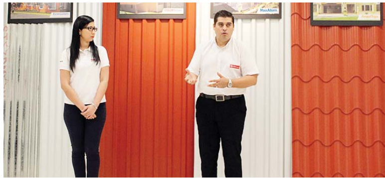
Los voceros de Ferromax durante la presentación del portafolio de cubiertas de techos.

Se acerca la temporada de lluvia y pensando en sus clientes, ejecutivos de Ferromax, #1 en hierro y techos, ofrecieron una conferencia de prensa para presentar el portafolio más completo en cubiertas de techos que se ajustan a su gusto y presupuesto, fabricadas con materia prima y procesos de calidad mundial, para garantizar la máxima seguridad y máxima economía al mejor precio.