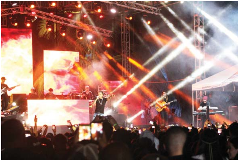
Ozuna prendió el ambiente con sus candentes ritmos y canciones.