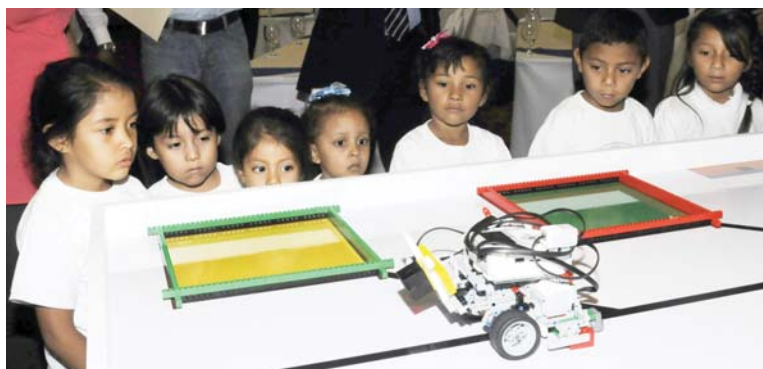
Niños invitados al lanzamiento por parte de Fundación Ficohsa.