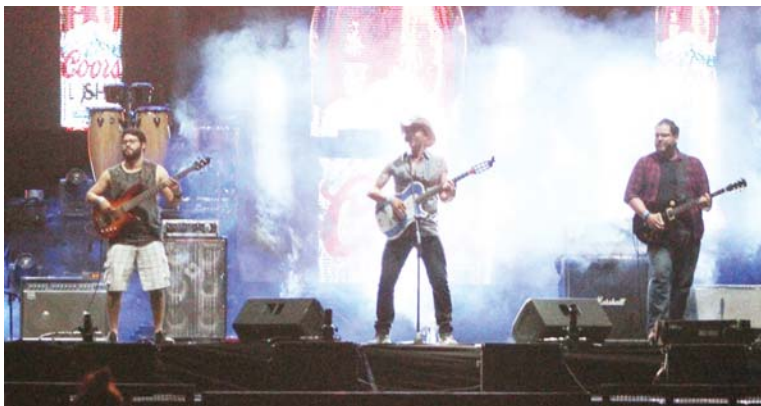
Polache fue uno de los más esperados.

Coors Light deja claro que lo más importante es darles a sus consumidores experiencias sin precedentes, con eventos de alto nivel, donde se disfruta un ambiente lleno de música y diversión, más cuando Coors Light, la cerveza más refrescante del mundo está presente.