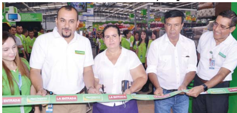
Corte de cinta inaugural de la Despensa La Entrada, Copán.

La primera tienda Maxi Despensa abre sus puertas en La Entrada, Copán, para ofrecer a los vecinos del sector una alternativa para adquirir productos con altos estándares de calidad a los precios más bajos.