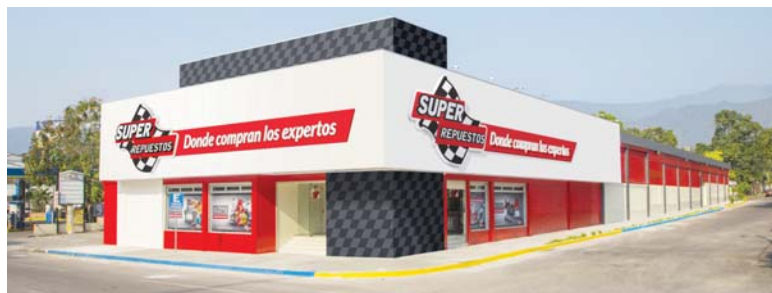
Fachada del almacén Súper Repuestos en San Pedro Sula.

Súper Repuestos, la cadena líder en El Salvador con 49 años de experiencia en la venta de repuestos y accesorios para vehículos livianos, se expande en Honduras e inaugura su cuarto almacén ubicado en San Pedro Sula.