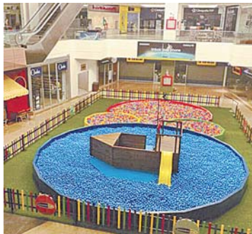
El gigantesco y fascinante océano de pelotas de Happy Sea, está esperando por tus niños.