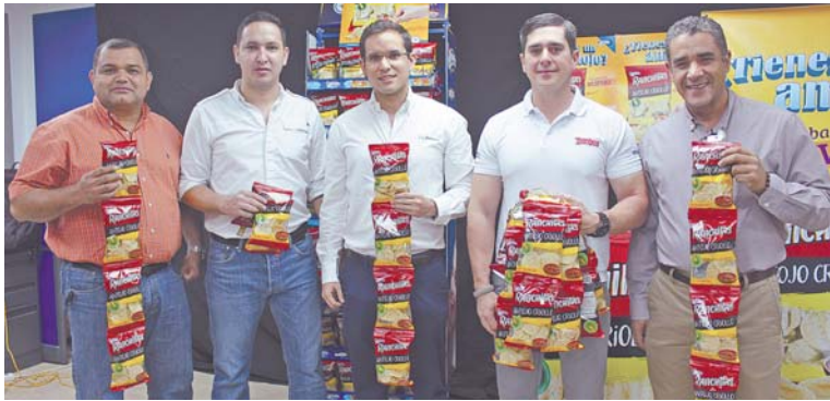
Ejecutivos de Yummies muestran las nuevas y deliciosas Ranchitas Antojito Criollo.

Snacks Yummies continúa expandiendo su familia de las tan gustadas Ranchitas y presenta el nuevo sabor denominado Antojito Criollo.