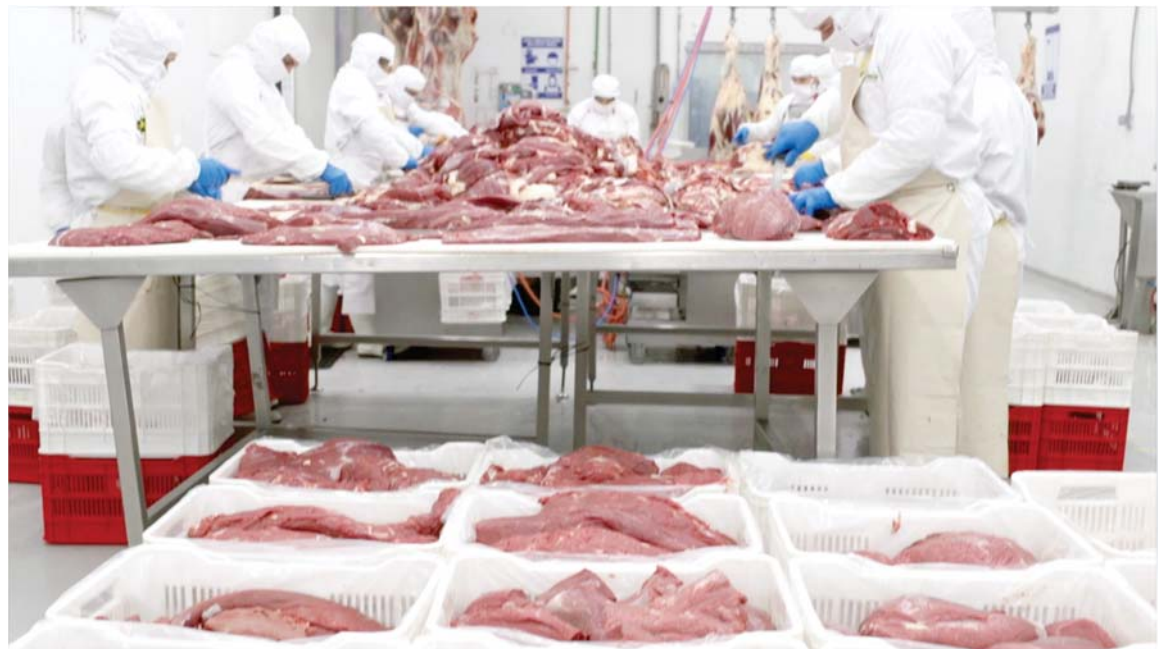
En el Centro de Procesamiento de Carnes los lotes de ganado son seleccionados especialmente para los clientes de Supermercados La Colonia.