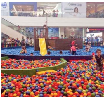
Los pequeños se divierten a más no poder en la gigantes piscina de bolitas de Cascadas Mall.