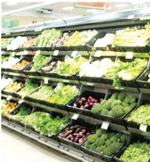
El área de frutas y verduras se amplió, ofreciendo una gran variedad de productos