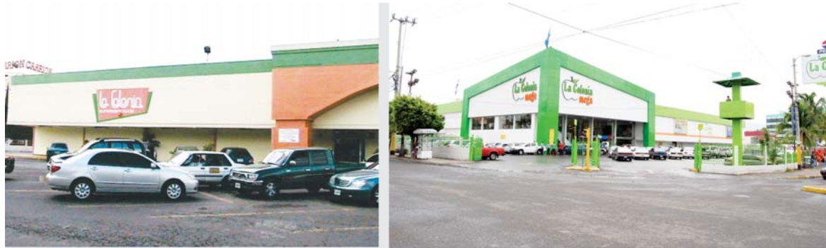
La Colonia número 1 renueva completamente su imagen para continuar brindando a sus clientes una experiencia única de compra.

La Colonia, nuevamente agradece a todos sus clientes por el apoyo invaluable en estos 42 años juntos, construyendo memorias, experiencias, éxitos y sobre todo estamos orgullosos de decir que estamos en el corazón de las familias hondureñas.