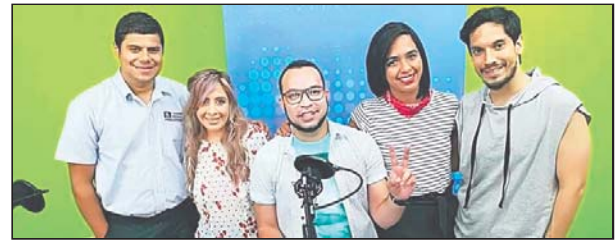
Jóvenes talentos se unen a Danilo en esta nueva propuesta televisiva.