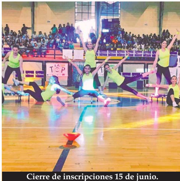
Cierre de inscripciones 15 de junio.

El talento y creatividad la pones tú, así que alístate e inscríbete ya, la fecha límite para que te registres es este 15 de junio, para más información marca el teléfono 3290-9064. Te invita por supuesto tu revista Vivela y La Top.