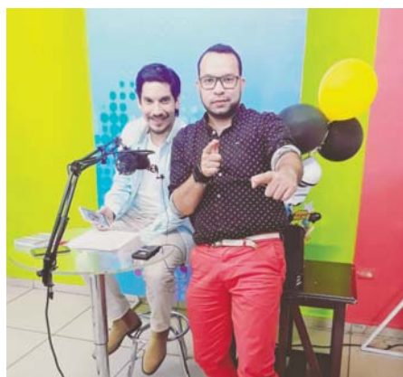
No te pierdas “Espacio Joven” a las 4:00 pm por la señal de Hondured.