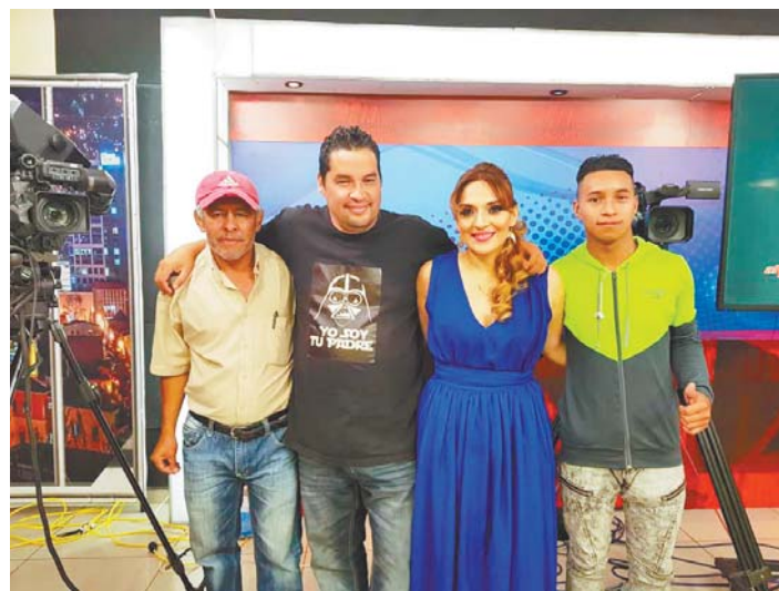
El equipo de Hondured pendiente de cada detalle, apoyando la revista TV Magazine para que salga con gran calidad al aire.