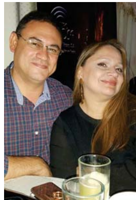
Un gran ambiente se vivió en la fiesta VIP donde las finas atenciones y las sorpresas animaron la noche.