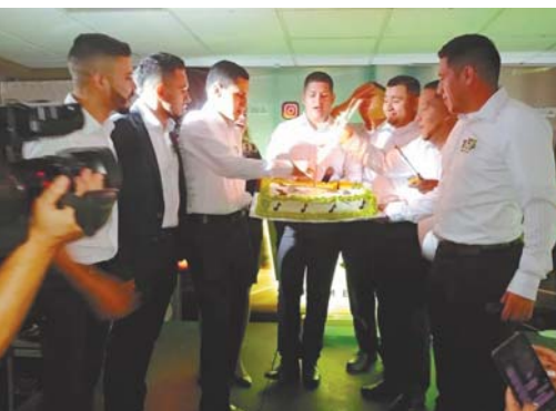
Al estilo urbano los chicos cantaron las mañanitas para cortar el delicioso pastel.