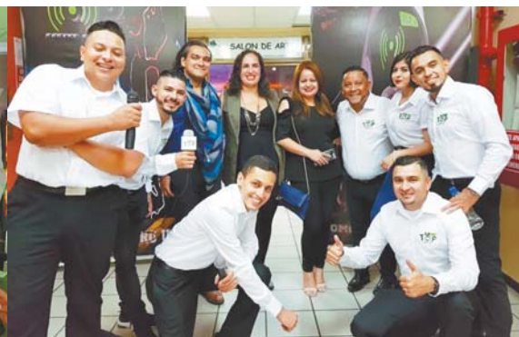
Los chicos del staff de La Top recibieron con mucha alegría los invitados especiales de la noche, agradeciendo su preferencia durante estos años.