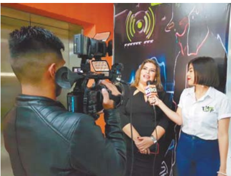
Medios de comunicación aliados de La Top se hicieron presentes en la celebración de aniversario.