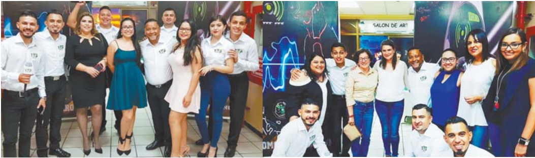
Amigos, clientes y agencias de publicidad disfrutaron de la fiesta VIP de La Top 107.7 que cerraba con broche de oro las actividades de su mes de aniversario.

La Top 107.7 culminó su mes de aniversario con broche de oro, agasajando a clientes y amigos con su fiesta VIP donde las sorpresas, los premios y la buena música no se hicieron esperar.