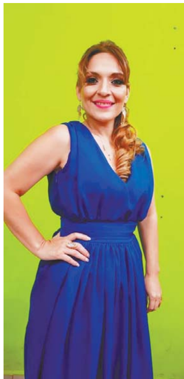
Disfruta de la revista televisiva TV Magazine los sábados a partir de las 7:00 pm.