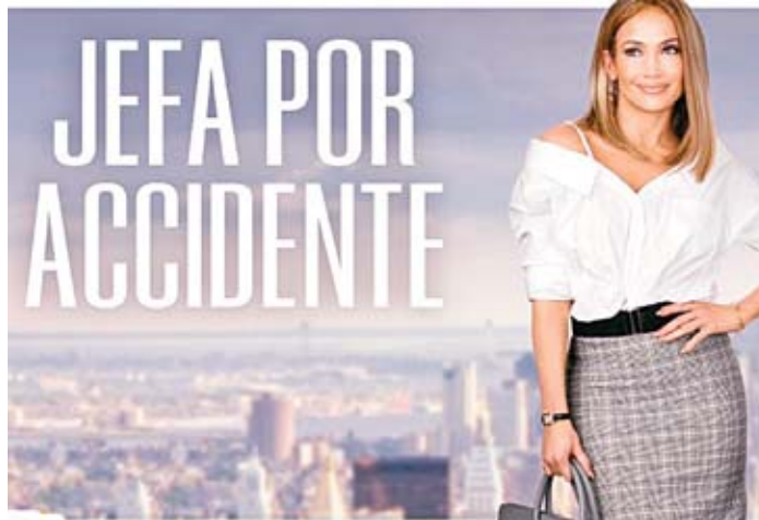
Jennifer López encantará al público con su nueva película, "Jefa por Accidente".

Es ahí donde todo se complica ya que el destino le tenía preparada una sorpresa inesperada. Sin duda una divertida comedia romántica que no debes dejar de ver en tu cine favorito, en todo el país.