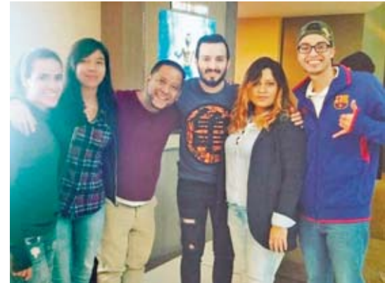
Nuestros lectores disfrutaron al máximo de esta exclusiva premier de Vívela de Dragon Ball Super: Broly .