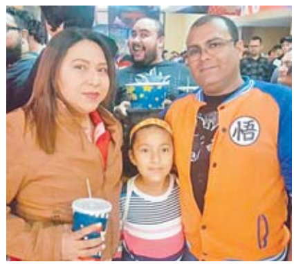
Cientos de fans del Dragon Ball se hicieron presentes en nuestra gran premier.

que realizaron una exposición que fue del gusto de los asistentes. Al final de la proyección nuestros lectores y fans del personaje salieron más que felices con la película, recomendándola a todo el público para que disfruten en la pantalla grande de este cómic.